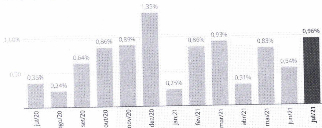
Gráfico: Economia/G1 • Fonte: IBGE